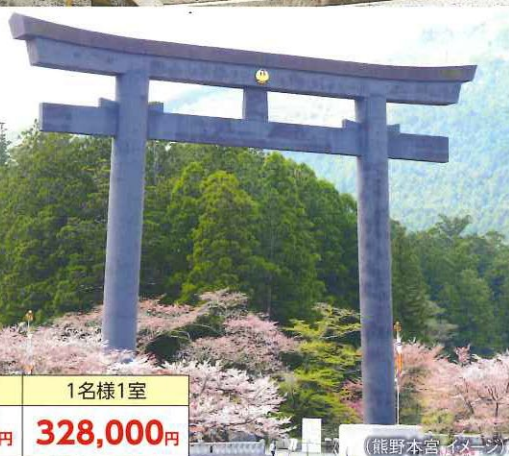
熊野本宮 イメージ