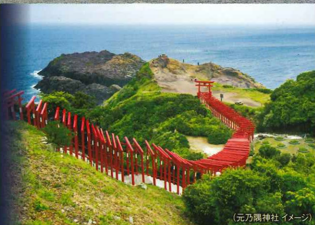
(元乃隈神社イメージ)

—— 航空機、新幹線、電車、モノレールなど —— バス、タクシーなど … 徒歩 ※行程中の時間は予定時間(目安)です。〈●入場又は乗船観光 ◎下車観光 ○車窓観光〉