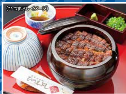
(ひつまぶしイメージ)