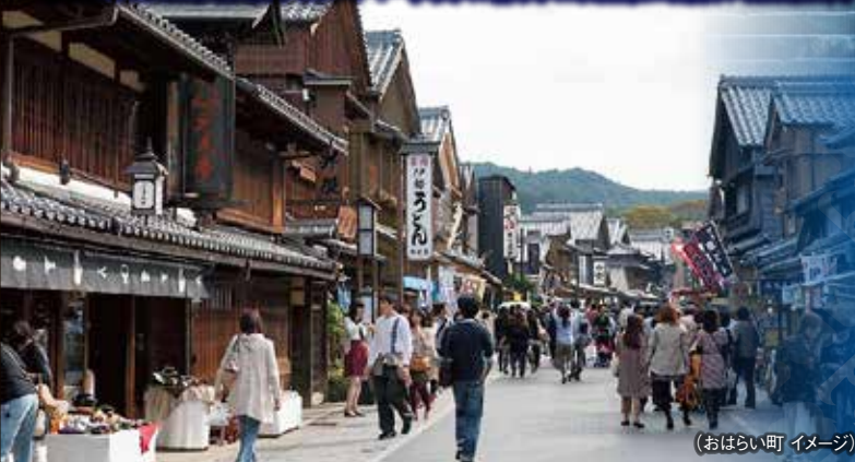
(おはらい町 イメージ)