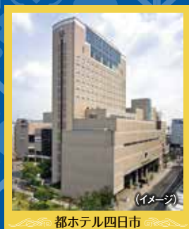
(イメージ) 都ホテル四日市