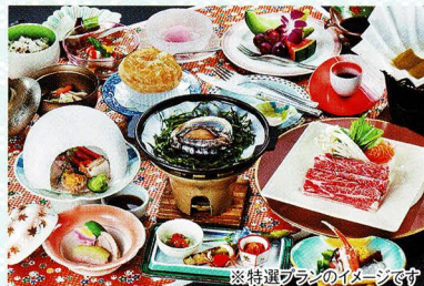
※特選プランのイメージです