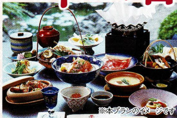
※本プランのイメージです