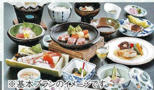
※基本プランのイメージです。