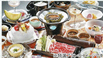
※特選プランのイメージです。