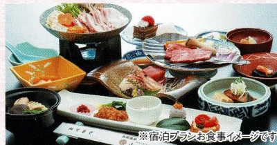
※宿泊プランお食事イメージです