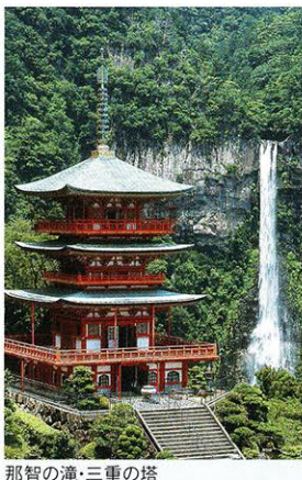
那智の滝・三重の塔