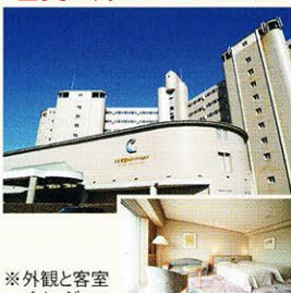
※外観と客室 イメージ