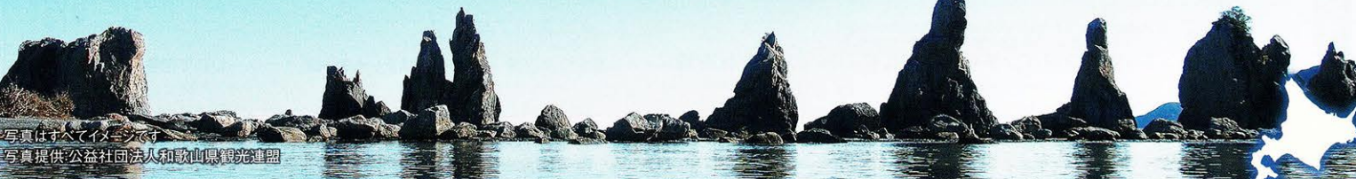
写真はすべてイメージです

憧れのジャイアントパンダファミリーに感動接近! 『白浜アドベンチャーワールド』にも入園します。