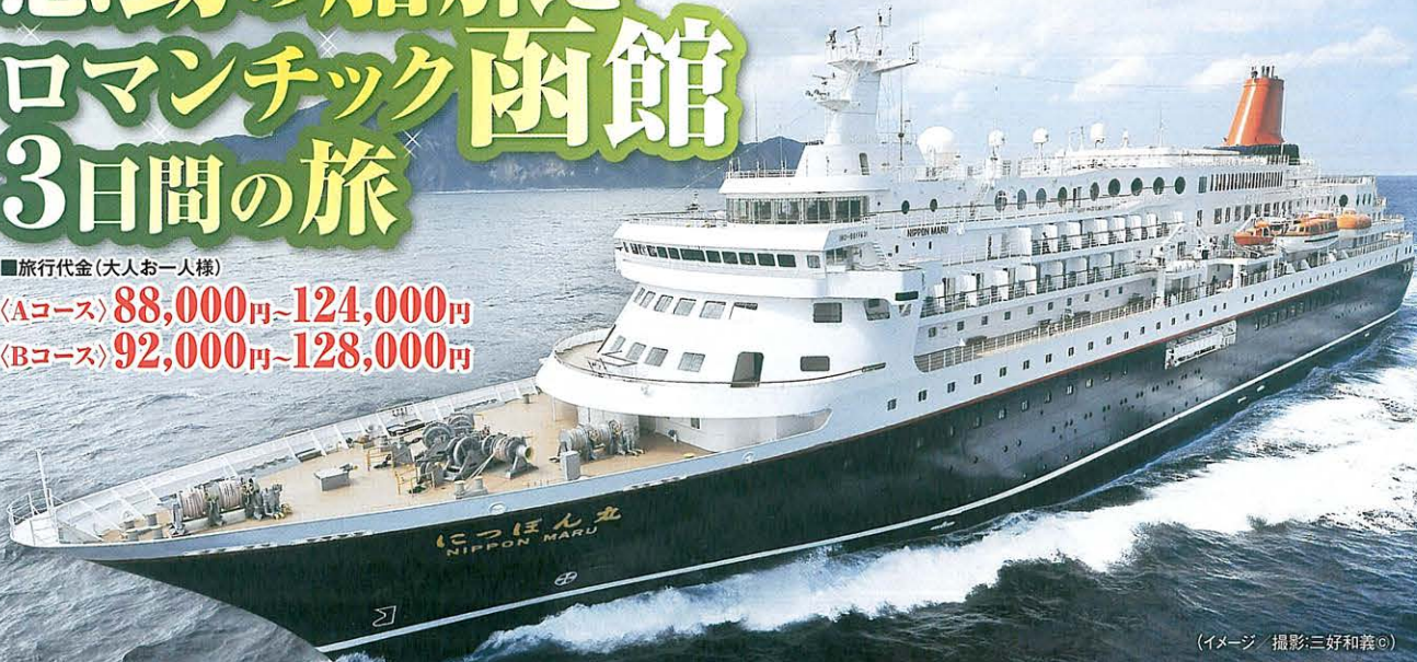
(イメージ)