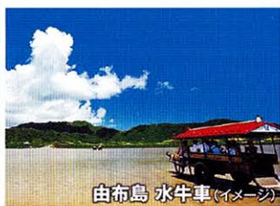
由布島 水牛車 (イメージ)