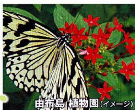
由布島 植物園 (イメージ)