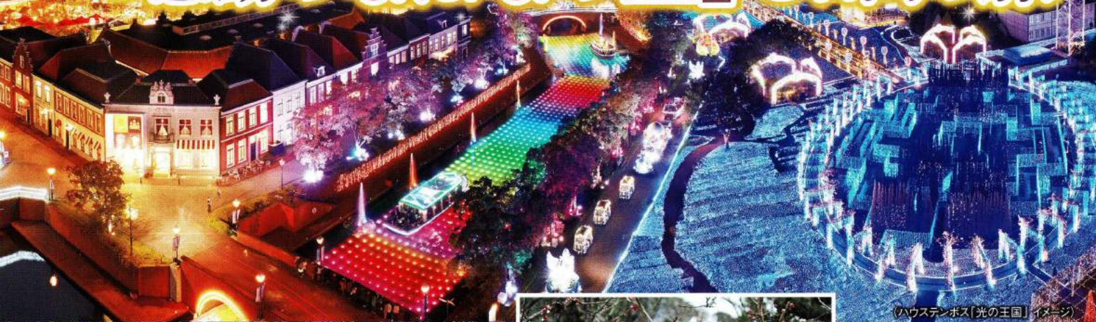
(ハウステンボス「光の王国」イメージ)