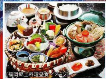
(福岡郷土料理昼食イメージ)