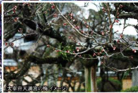
(太宰府天満宮の梅イメージ)